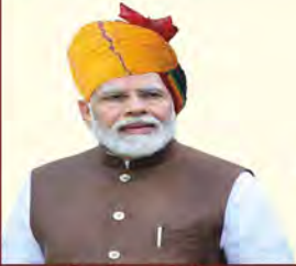
श्री नरेन्द्र मोदी माननीय प्रधानमंत्री