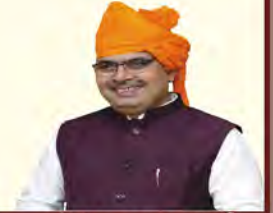
श्री भजनलाल शर्मा माननीय मुख्यमंत्री